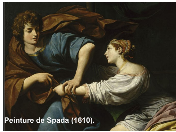
Peinture de Spada (1610).